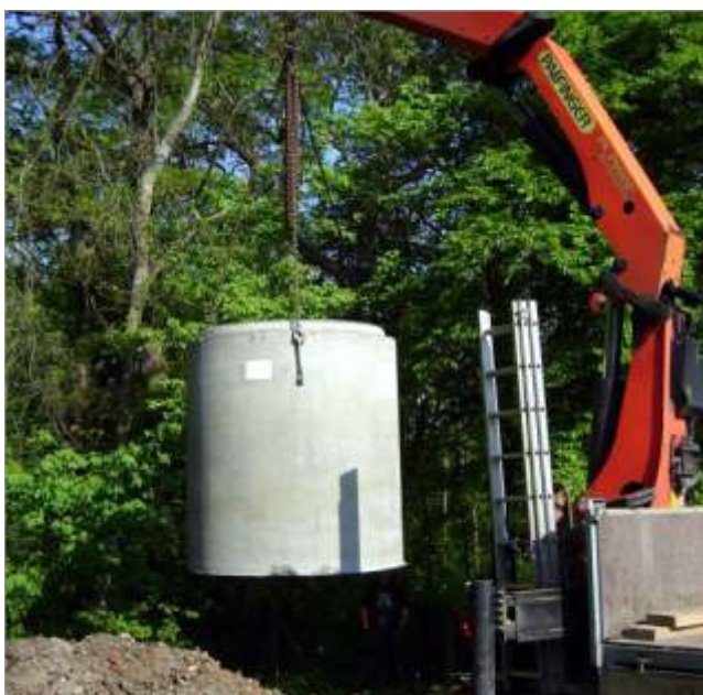
↑ Setzen des Basisbehälters vom Liefer-LKW